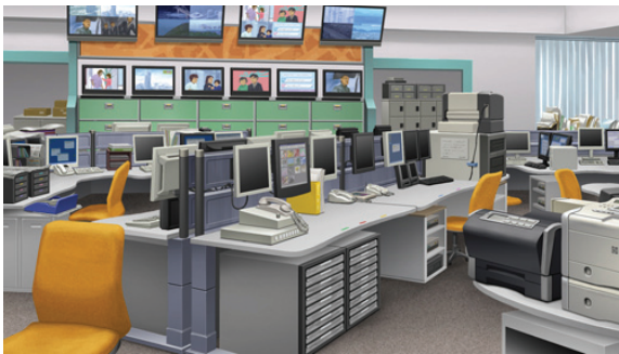
『特殊報道部』の背景グラフィックより