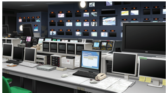
※画像は開発中のものです。